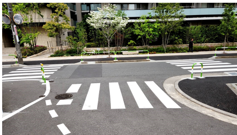
ガードレールが無くなり横断歩道の白線が引かれる

都営王子5丁目アパート裏のセブンイレブン王子5丁目店前の道路が、王子第一小学校の通学路となっているため、一昨年より、地元の皆さんから「この交差点に横断歩道があれば安全」との要望を受け北区に相談し、横断歩道の設置が決まりました。