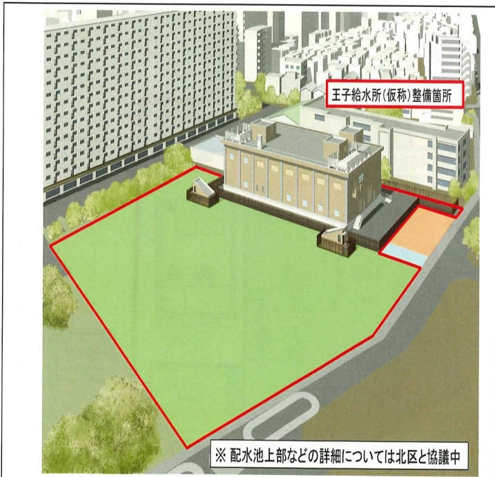
※ 配水池上部などの詳細については北区と協議中