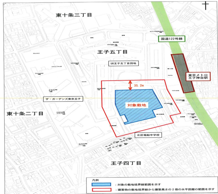
対象敷地 地名地番:王子5丁目1番46 住居表示:王子5丁目2番

お困り事などありましたらお寄せください。そね都議とともに、住民の皆さんが安心して過ごせるよう区や都に要請をしていきます。