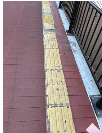
東十条駅南口 下十条運転区跡地前 点字ブロックの補修